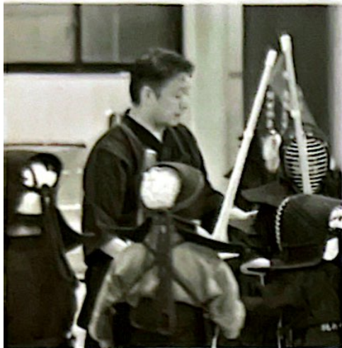
これからも剣道の楽しさを伝えていく

とは私と稽古してよかったな、また稽古をしたいな、と思ってもらえることです。「交剣知愛」という言葉があります