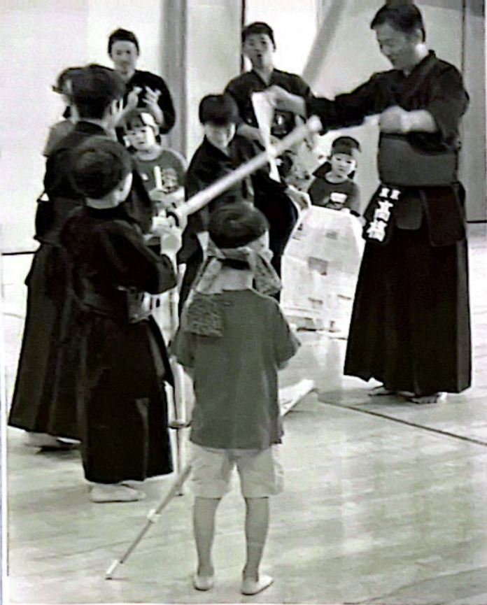
幼児への稽古指導